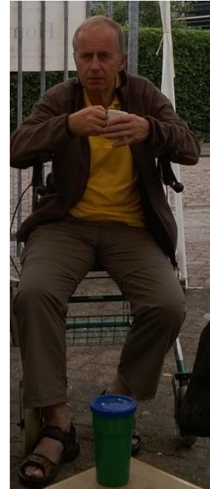
Rollators testen wij zelf..

In 2013 werden de midzomerfeesten gewijzigd. Alleen op de zondag werd een braderie gehouden. Zaterdag werden andere activiteiten georganiseerd. De winkel bleef op zaterdag langer open. De opbrengst van 2013 overtrof de opbrengst van 2012 ondanks geringere openstelling. Voor 2014 als uitgangspunt goed; de winkel kan sluiten omstreeks 14.00 uur.