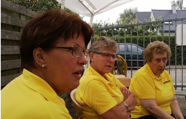
Tijd voor pauze bij de braderie